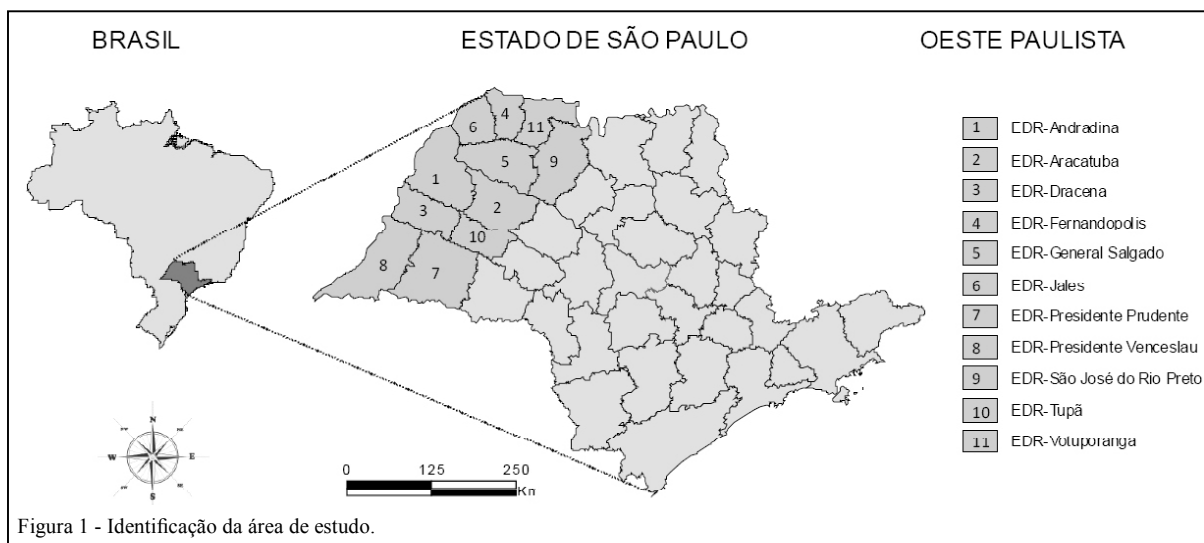
Figura 1 - Identificação da área de estudo.

agricultável se modifica em um determinado período, devido à alteração do tamanho ou escala do conjunto formado pelas atividades que concorrem pelo fator terra, ou pela substituição de um produto por outro dentro desse conjunto.